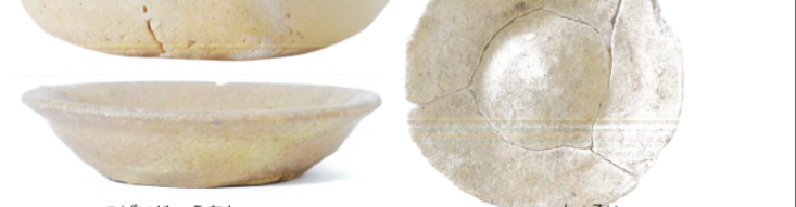
椿井城跡からいろいろな種類の土器などが発掘されています