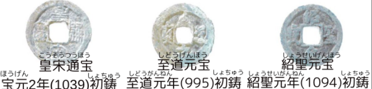
皇宋通宝 至道元宝 紹聖元宝 宝元2年(1039)初鑄 至道元年(995)初鑄 紹聖元年(1094)初鑄