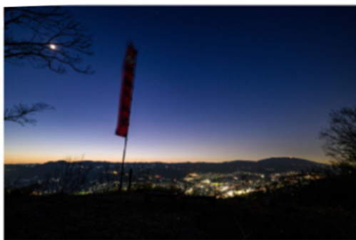
夜の樅井城跡の景色